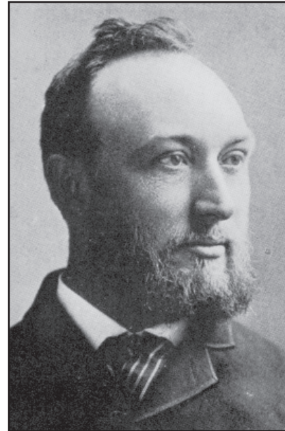
ادوارد سی. پیکرینگ