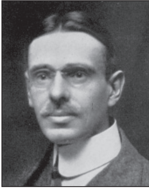
ویلیام تیلر الکات

در اواسط دهی ۱۸۹۰، مدیر رصدخانه ی دانشگاه هاروارد، ادوین سی پیکرینگ، مشاهده کرد که کلید درگیر کردن بیشتر آماتورها در رصد ستارگان متغیر - تا کیفیت و ثبات اندازه گیری ها تضمین شوند- می تواند تهیه ی استاندارد متوالی مقایسه ای از ستارگانی باشد که بزرگی (حجم) معینی دارند. برای رصدگرهای مبتدی، اندازه گیری ستارگان متغیر می تواند کار راحت تری نسبت به دنبال کردن روش مراحل سخت باشد ( بوسیله ویلیام هرچل ابداع شد و بوسیله آرچی لاندر بهبود و ترفیع داده شد ) و می تواند تلاش زیاد را برای نتیجه گرفتن منحنی نوری کاهش دهد.